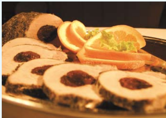
Schab nadziewany śliwką

Farfelki mogą być dodatkiem do zupy. W tym przypadku należy je gotować przez 30 minut w wrzącej, posolonej wodzie lub bezpośrednio w zupie.