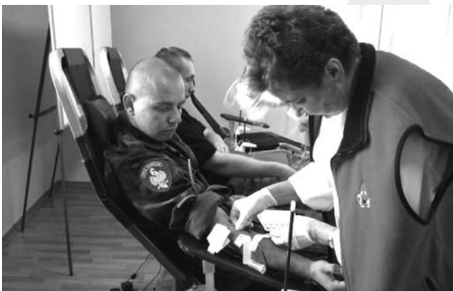
Funkcjonariusze w akcji honorowego krwiodawstwa

Funkcjonariusze Straży Granicznej składają życzenia zdrowych, wesółych i spokojnych Świąt Bożego Narodzenia oraz wszelkiej pomyślności w nadchodzącym Nowym Roku.