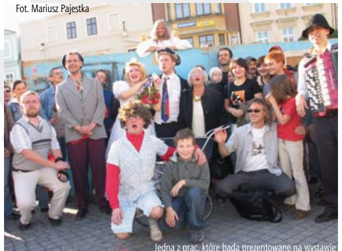
Jedna z prac, które będą prezentowane na wystawie