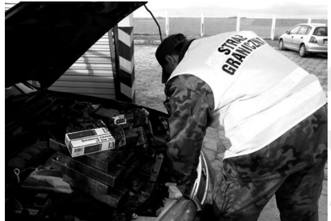
Ujawniony przemyt papierosów

W sytuacji dynamicznie wzrastającego ruchu lotniczego, uruchamiania nowych połączeń, systematycznie wzrastającej ilości podróżnych oraz rozbudowy portu lotniczego, na placówce tej spoczywa coraz więcej zadań związanych nie tylko z kontrolą ruchu granicznego, ale przede wszystkim zapewnieniem bezpieczeństwa w komunikacji lotniczej.