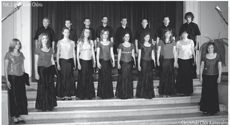
Cieszyński Chór Kameralny

Dla chórzystów lutowa (2007) sesja nagraniowa kojarzyć się będzie z ogromnymi ilościami zjedzonej cebuli, dzięki której przetrwały ich gardła w ciągu 3 dni nagrań w chłodnych wnętrzach małego, ale jakże uroczego kościółka ewangelickiego w Ogrodzonej. Choć parafia udostępniła ogrzewany kościół, mróz panujący na zewnątrz studził gorącą atmosferę wielogodzinnej pracy przy mikrofonach. Chór spotkał się z przychylnością gospodarzy okolicznych pól. W maju, gdy trwała druga sesja nagraniowa zrezygnowali oni z prac tworząc